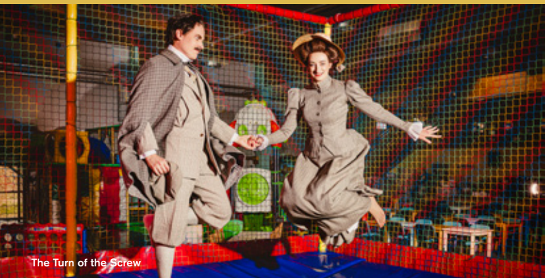
The Turn of the Screw