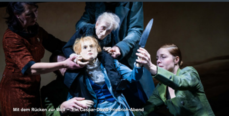
Mit dem Rücken zur Welt – Ein Caspar-David-Friedrich-Abend