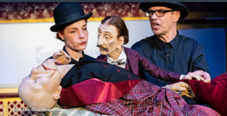
Mord im Orientexpress