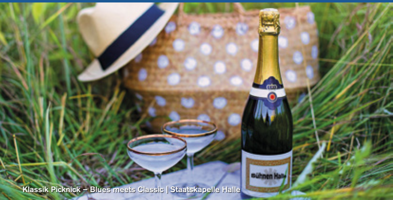
Klassik Picknick – Blues meets Classic | Staatskapelle Halle