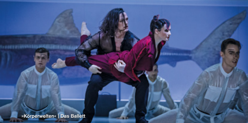
»Körperwelten« | Das Ballett