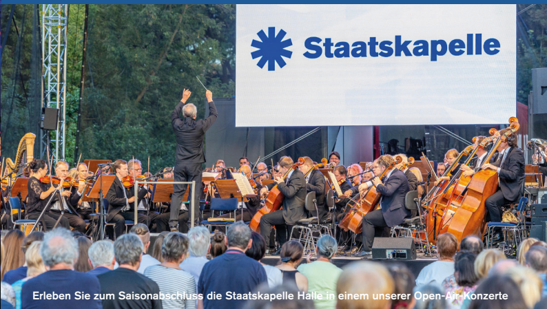
Erleben Sie zum Saisonabschluss die Staatskapelle Halle in einem unserer Open-Air-Konzerte