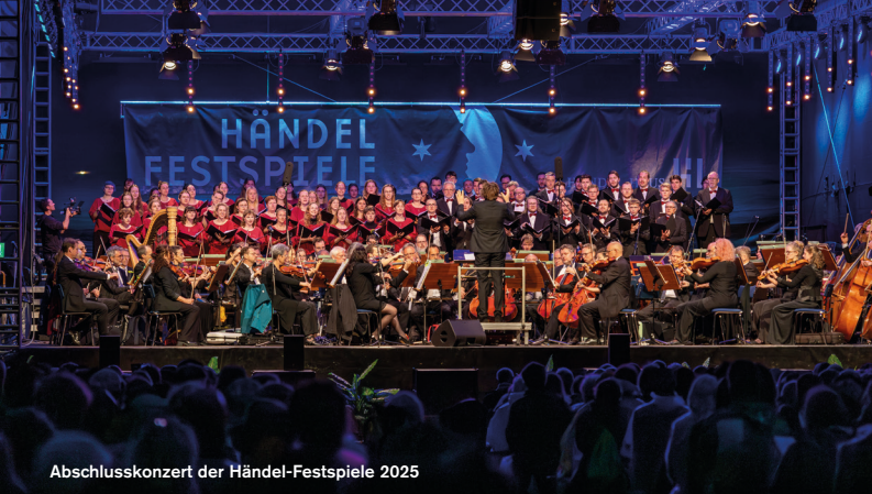
Abschlusskonzert der Händel-Festspiele 2025