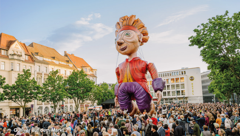
Gulliver auf dem Markt