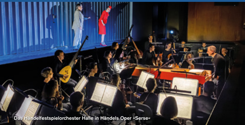
Das Händelfestspielorchester Halle in Händels Oper »Serse«