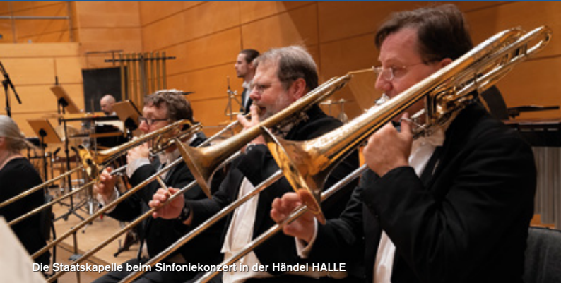
Die Staatskapelle beim Sinfoniekonzert in der Händel HALLE